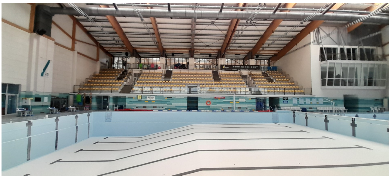
Widok ogólny od strony zachodniej