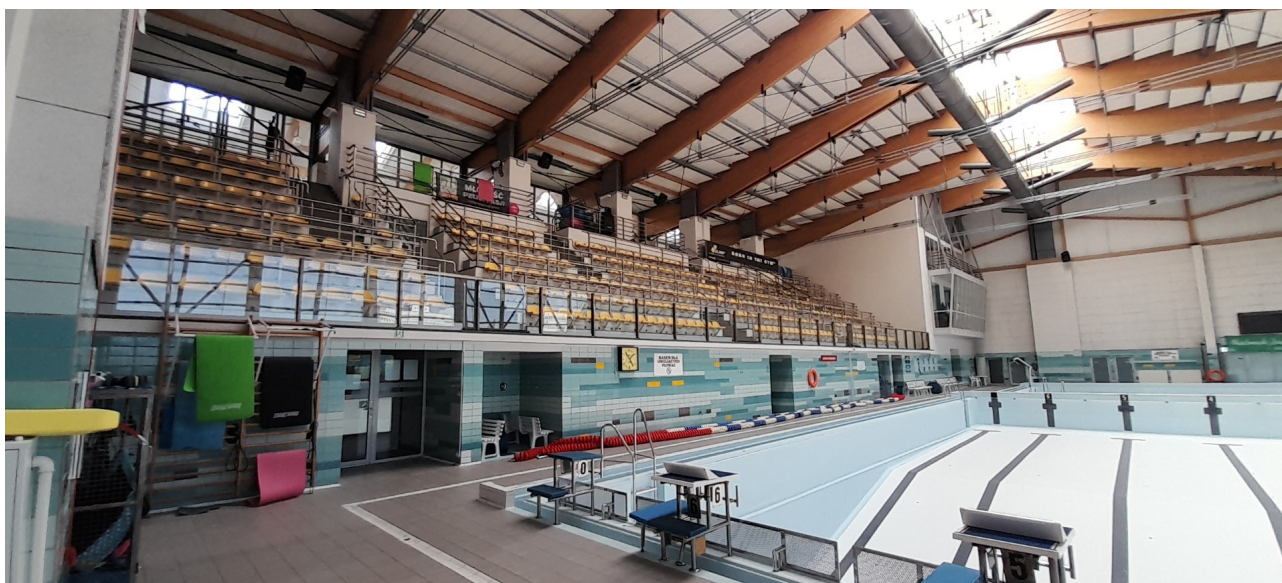
Widok ogólny od strony północnej