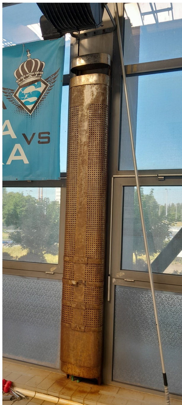
Obudowa grzejników przy ślusarce fasadowej – obudowa typowa