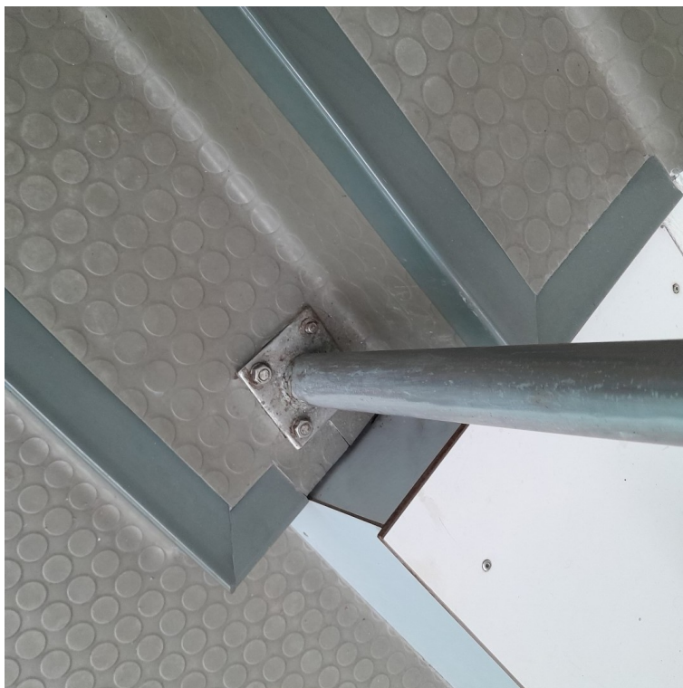
Balustrada typ 1, montaż do podłoża