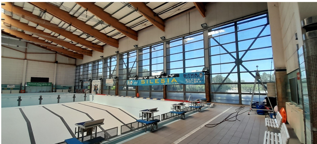
Widok ogólny od strony północnej