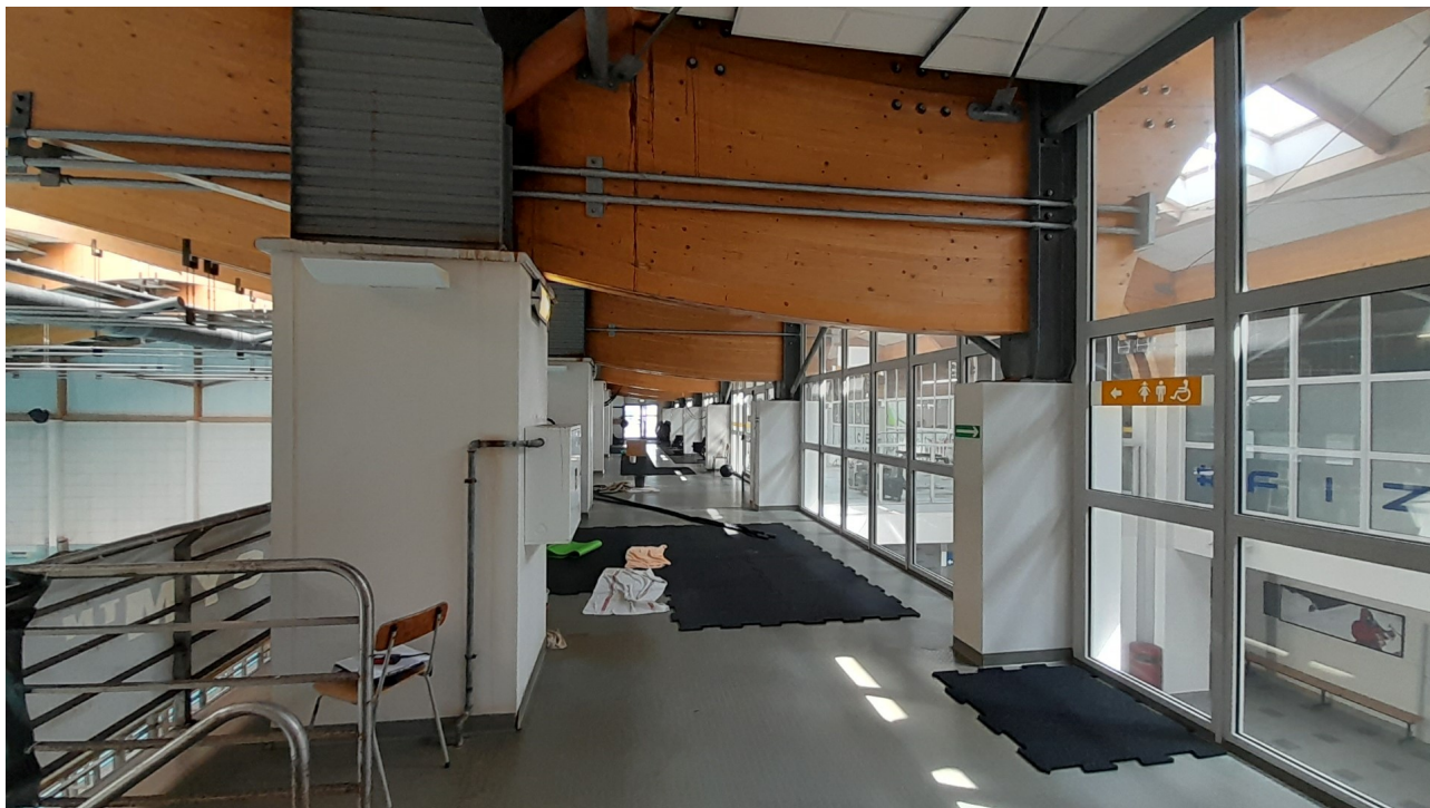
Poziom +2 widowni