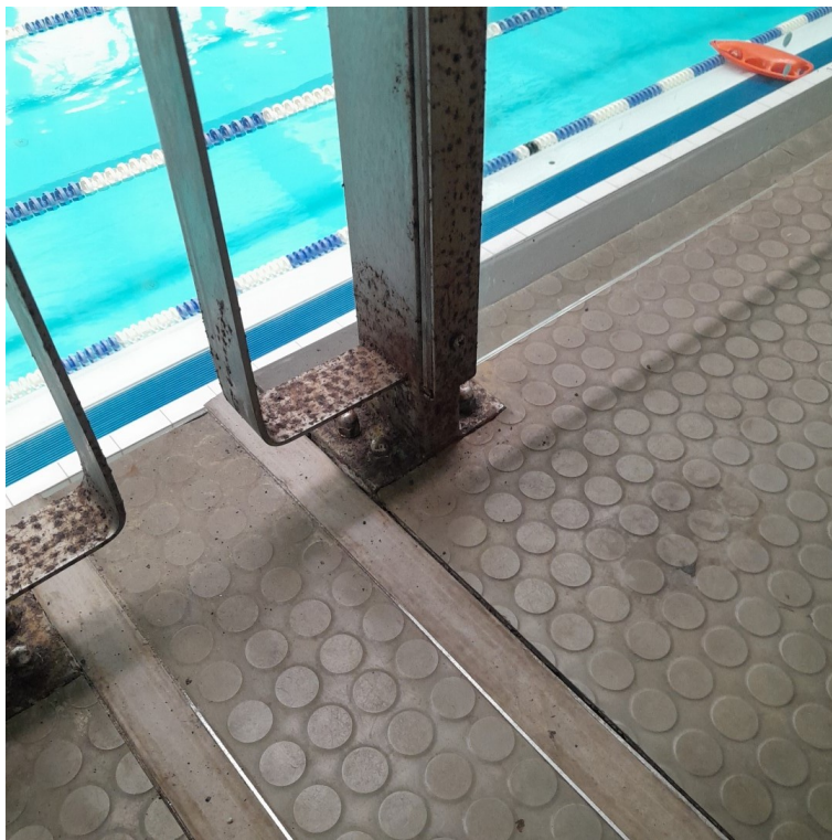
Balustrada typ 2, montaż do podłoża i dylatacja