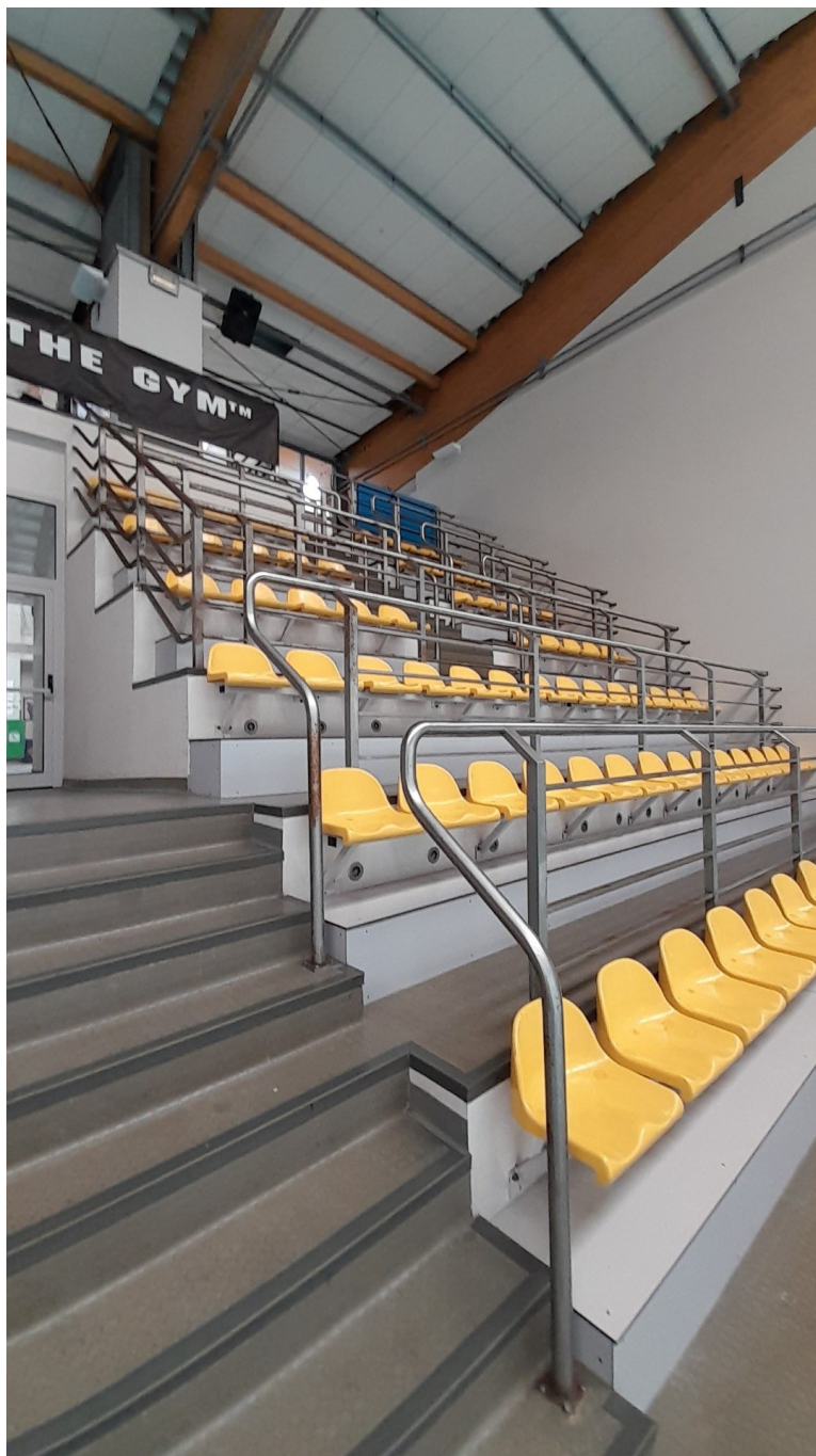
Balustrada typ 1