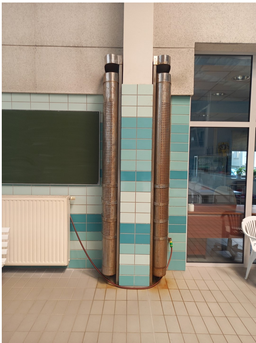
Obudowy grzejników przy ścianach szczytowych