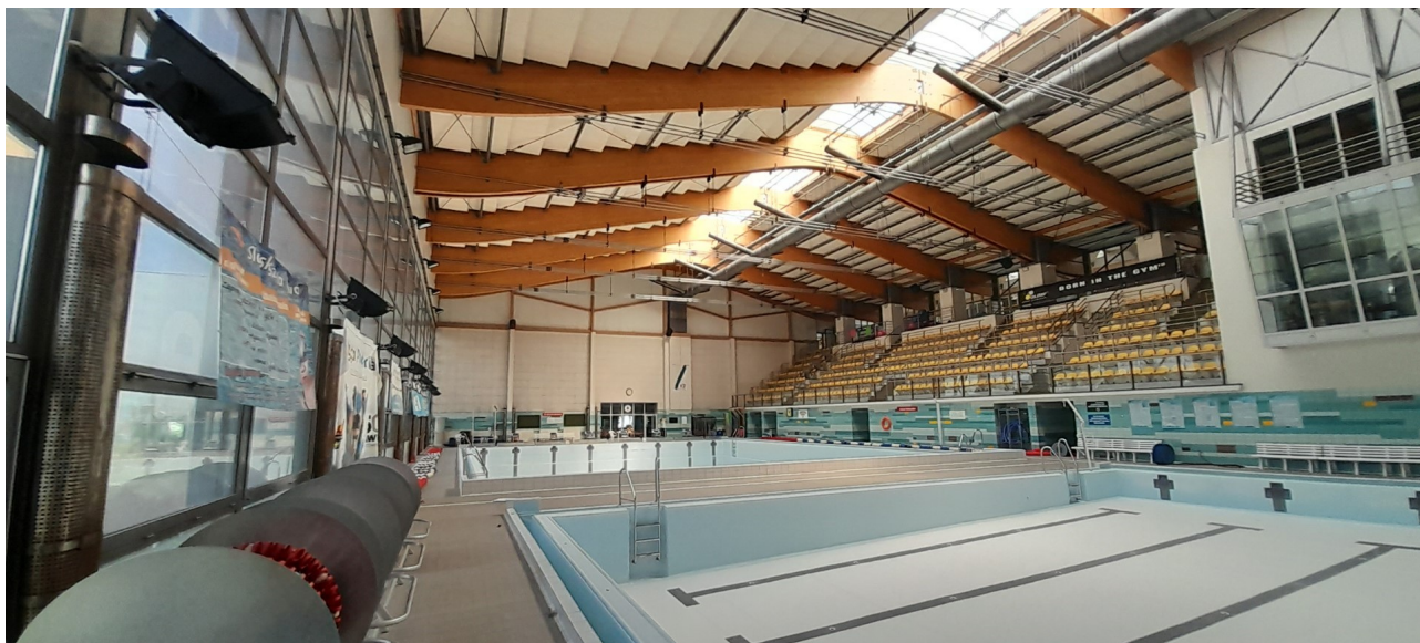
Widok ogólny od strony południowej