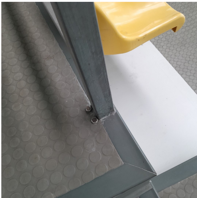
Balustrada typ 1, montaż do podłoża