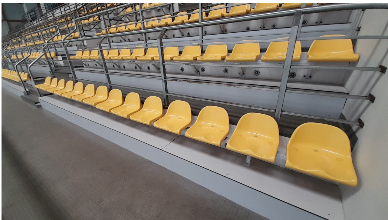
Balustrada typ 1