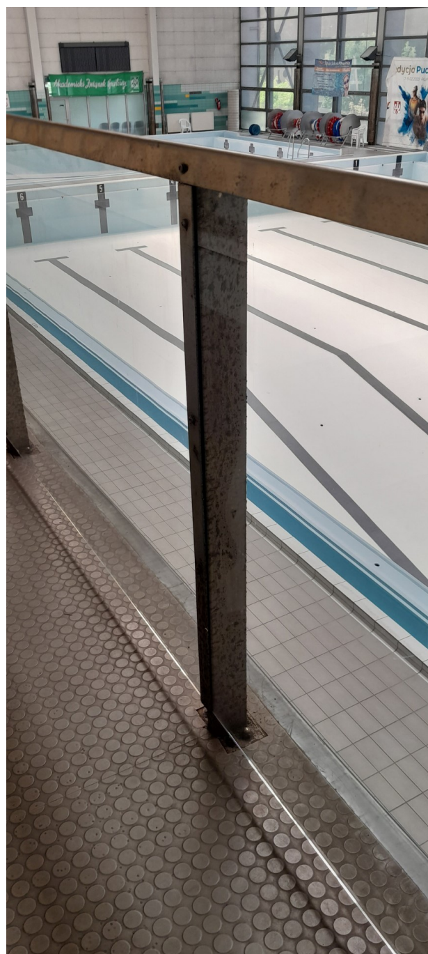
Balustrada typ 2