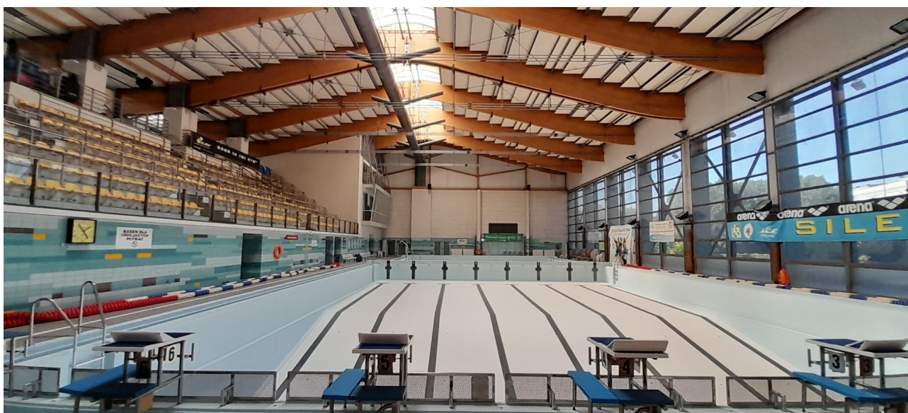
Widok ogólny od strony północnej