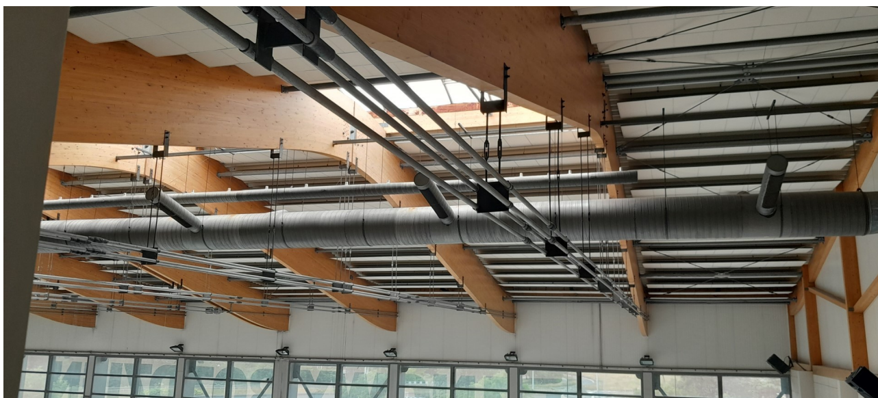
Poziomy wentylacji mechanicznej, wywiewny i nawiewny