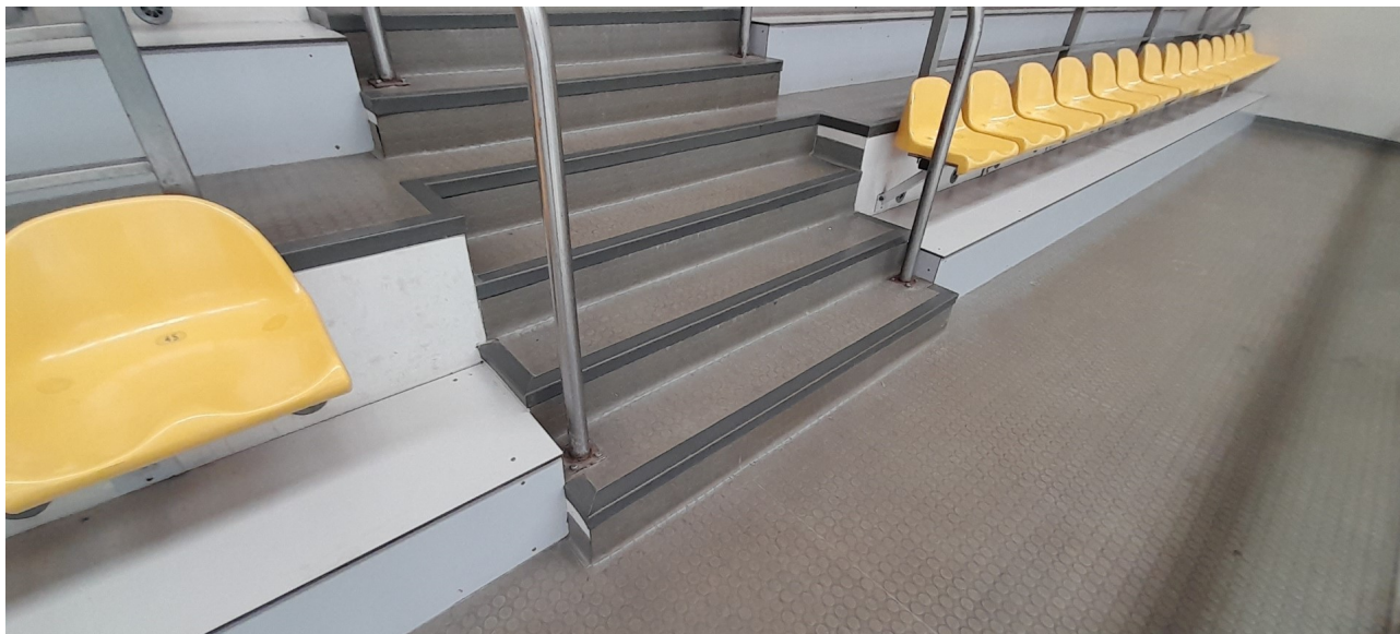
Wykładzina PVC widowni i obudowy HPL pod siedziskami