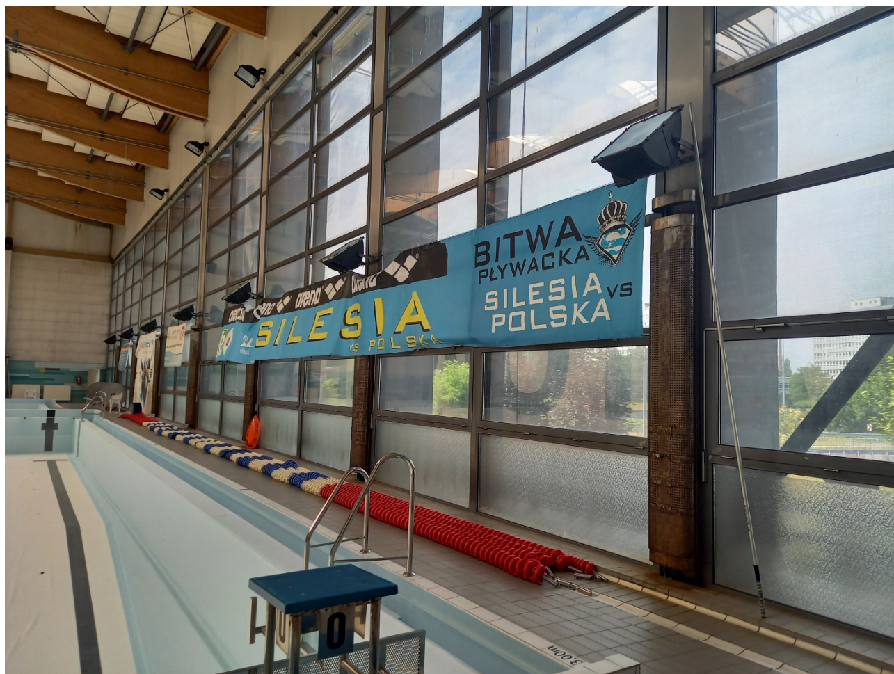
Obudowy grzejników przy ślusarce fasadowej i oprawy oświetleniowe