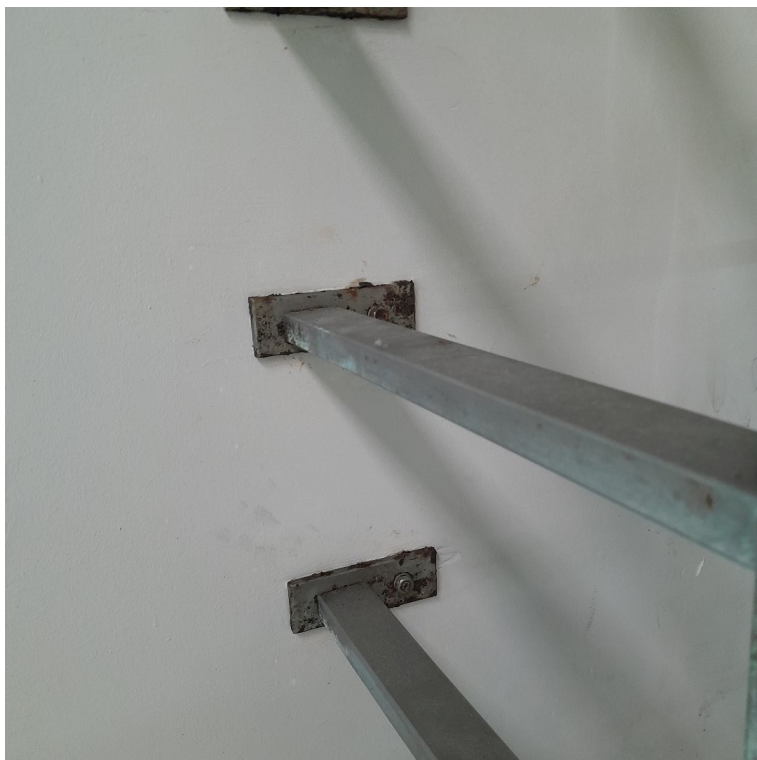
Balustrada typ 1, montaż do ściany