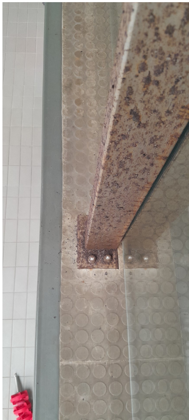
Balustrada typ 2, montaż do podłoża