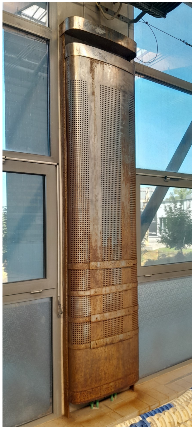
Obudowa grzejników przy ślusarce fasadowej – obudowa przy dylatacji