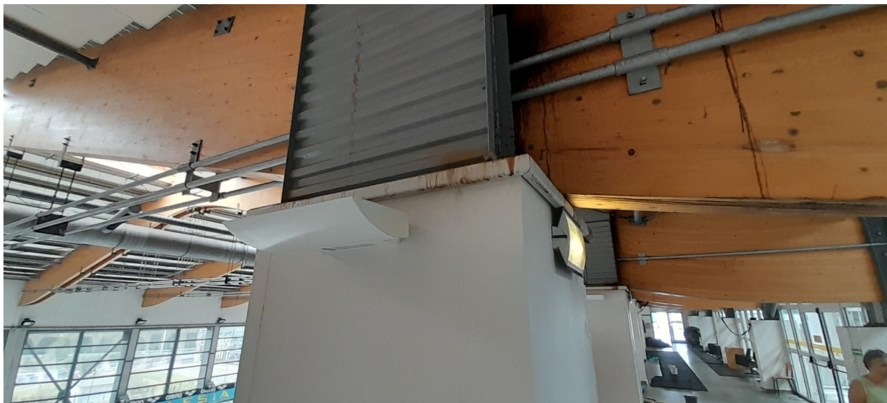
Lampy na widowni i profil wieńczący PCV