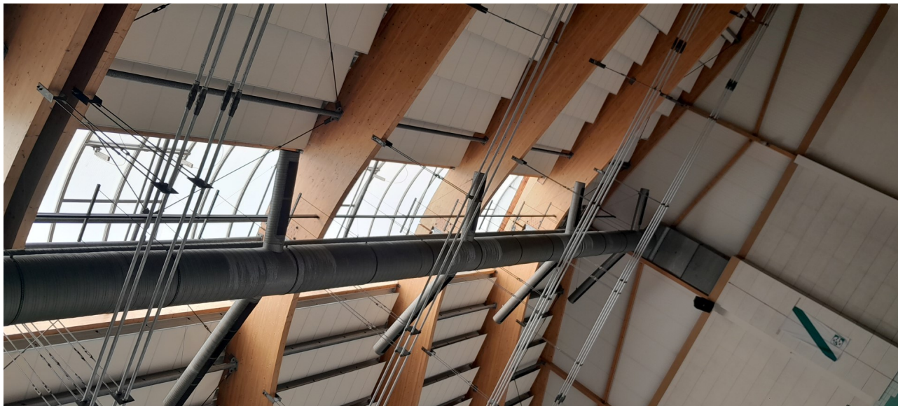
Poziomy wentylacji mechanicznej, wywiewny i nawiewny